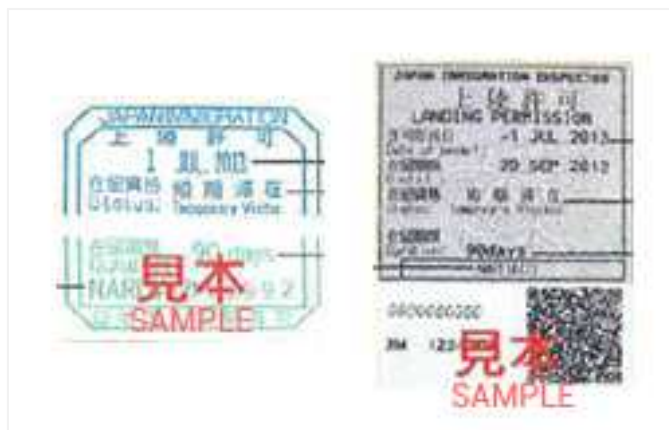
ตัวอย่างตราประทับของสถานะ "Temporary Visitor"

“ผู้ที่ถือวีซ่าท่องเที่ยวชั่วคราว” ตามกฎหมายของญี่ปุ่น อนุญาตให้อยู่ในญี่ปุ่นระยะสั้น 15-90 วันโดยมีจุดประสงค์เพื่อการท่องเที่ยวเท่านั้น เมื่อขอวีซ่าท่องเที่ยวมาเที่ยวญี่ปุ่น เมื่อถึงสนามบินเจ้าหน้าที่ตรวจคนเข้าเมืองจะประทับตรา “นักท่องเที่ยวชั่วคราว” ให้ที่พาสปอร์ต การใช้เจอาร์เรลพาสจะจำกัดเฉพาะผู้มีสถานะนักท่องเที่ยวชั่วคราวประทับตราในพาสปอร์ตเท่านั้น